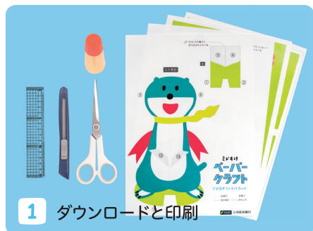
1 ダウンロードと印刷

A4用紙4枚(厚紙が最適)、はさみ、カッター 定規、のり(または接着剤、両面テープ)