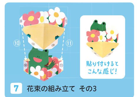
7 花束の組み立て その3