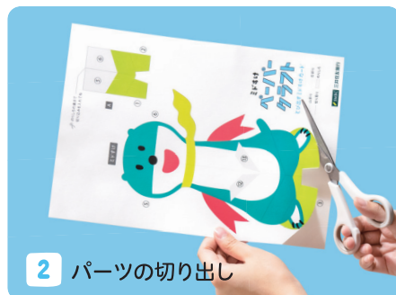
2 パーツの切り出し

ペーパークラフトのファイルをダウンロードし、プリンターで印刷します。印刷するA4用紙は、画用紙のような少し厚みのある紙が最適です。