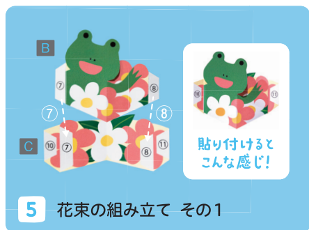
5 花束の組み立て その1

ミドすけパーツを平らな状態にし、土台に③④→⑤⑥の順で貼り付けます。⑤⑥は、③④を貼った後に自然とくる位置(頭の裏面)に貼り付けます。ミドすけの足部分は「うらのり」で貼ってください。